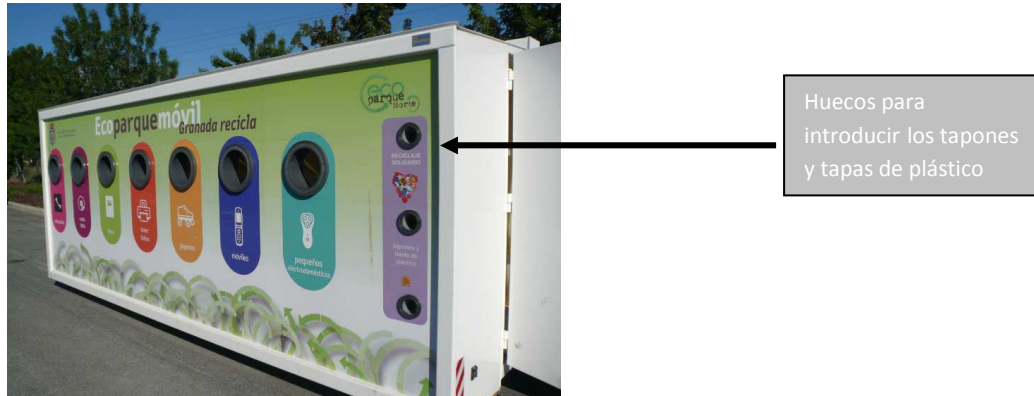
Foto: Ubicación de los huecos para reciclaje solidario en Eco Parque Móvil de Granada

El reciclaje solidario se lleva a cabo mediante la recogida de tapones y tapas de plástico a través del Eco Parque Móvil, en el cual se habilitaron huecos para tal finalidad, como puede observarse en la siguiente imagen: