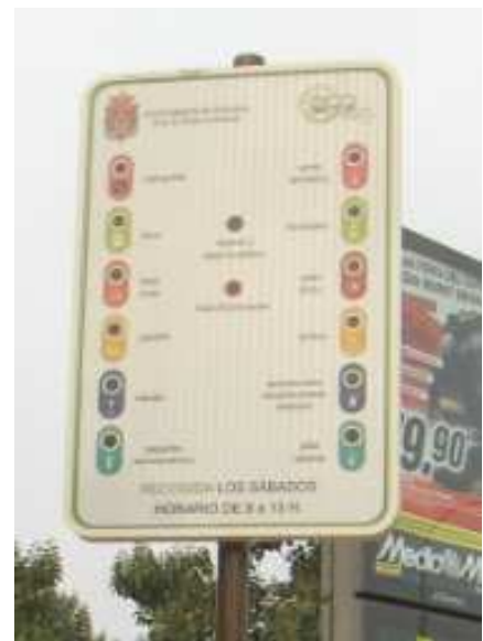
Fotos: Señalización indicativa de la presencia del Ecoparque Móvil de Granada

Concluidas las dos primeras fases, el Ecoparque Móvil se puso en marcha el día 5 de junio de 2012, aprovechando la celebración del Día del Medio Ambiente. No obstante hay que puntualizar que mientras se desarrollaban las dos primeras fases, el Ayuntamiento de Granada facilitó a los centros escolares interesados la ubicación del Ecoparque Móvil en dichos centros, para que lo ubicasen en sus patios y fuese calando entre los escolares su uso y funcionalidad. Con un poco esfuerzo por parte del profesorado y alumnado, se pretendía que se adquiriese un hábito de reciclaje. Fue ésta una actividad especialmente interesante para los centros educativos, ya que combinaba el desarrollo social y económico con la conservación del entorno. A su vez, los escolares transmitían el mensaje entre sus familiares, haciendo promoción del Ecoparque Móvil.