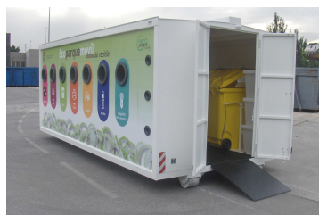
Fotos: Vista frontal y lateral del Ecoparque Móvil de Granada

Interiormente está compartimentado en distintos alojamientos para contenedores con capacidad individual 360 litros, destinados a recibir el depósito de las diferentes fracciones de RSU, de tal modo que son inequívocamente identificados por los usuarios el contenedor o contenedores a que ha de dirigirse para efectuar su depósito en función del tipo de residuo.